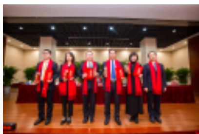
领航长江先进团队