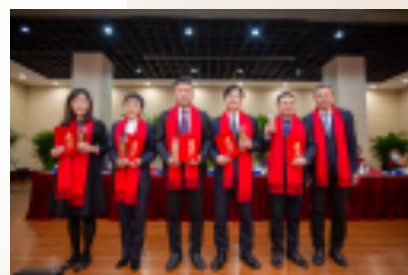
筑梦长江先进团队