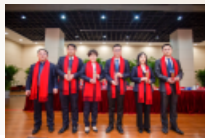
筑梦长江先进个人