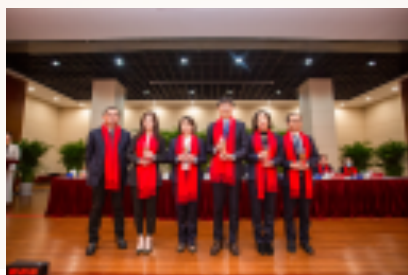
领航长江先进个人